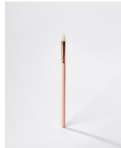
Lippenstift – the lip