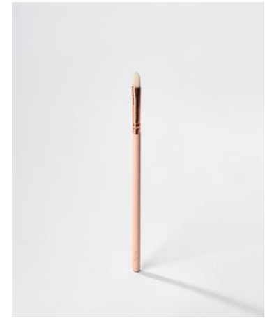
the blender – the lip