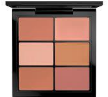
lipliner – the lip – Lippenstiftpalette