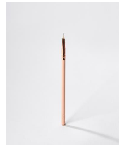
glitter – Wimpernkleber DUO – the liner