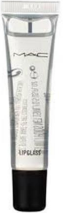
the blender - Lippenstiftpalette – lipglass