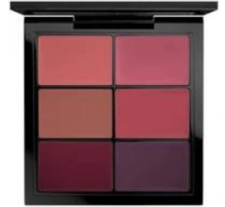
the blender – the lip Lippenstiftpalette