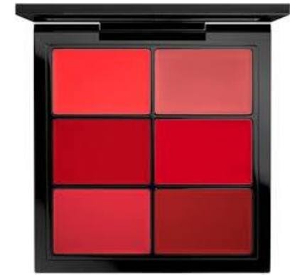
the blender – Lippenstiftpalette