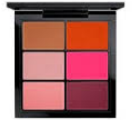
lipliner 2 Farben – the lip – Lippenstiftpalette