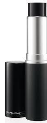
eye kohl – paint stick